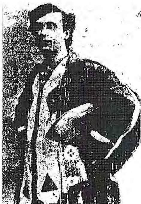
Foto van Charles A. Davenport zoals gepubliceerd in de Amsterdamsche Courant van 2 september 1891.

Advertentie in het Rotterdamsch Nieuwsblad van 29 oktober 1894 waarin melding wordt gemaakt van een kluchtspel over Sequah. Vergelijkbare advertentie in het Rotterdamsch Nieuwsblad van 26 mei 1896.